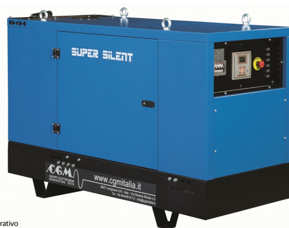
Le immagini sono puramente a titolo dimostrativo The images are only for demonstration purposes Cettes images sont utilisées uniquement à des fins de démonstration