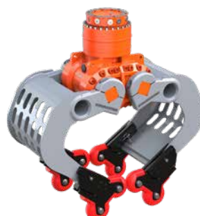
optionale 4-Grip Ansteckvorrichtung, hier angebart an einem D04HPX